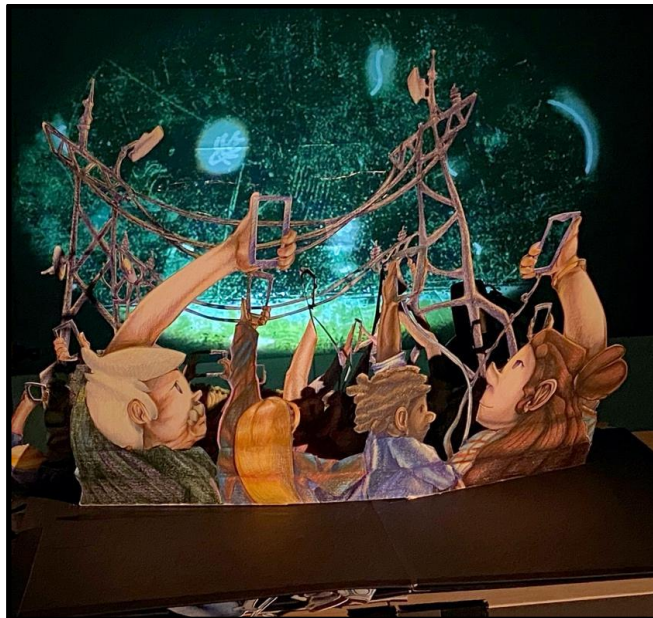
« Décors dépliant illustrés aux crayons de couleur »

Gilles Thiam : Chargé de production et de diffusion